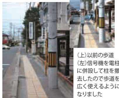
(上)以前の歩道 (左)信号機を電柱 に併設して柱を撤 去したので歩道 を広く使えるよ うになりました

板橋学区の見守り隊の皆さまか ら要望のあった信号機の移動工 事が終わりました。電柱に信号機 を併設して歩道が広く使えるよ うになり、子どもたちが雨の日に 傘をさしても行き来できます。通 学中の安全安心がひとつ形にな りました。皆さまのまわりでもお 気づきのことがありましたら、お 声をかけてください。